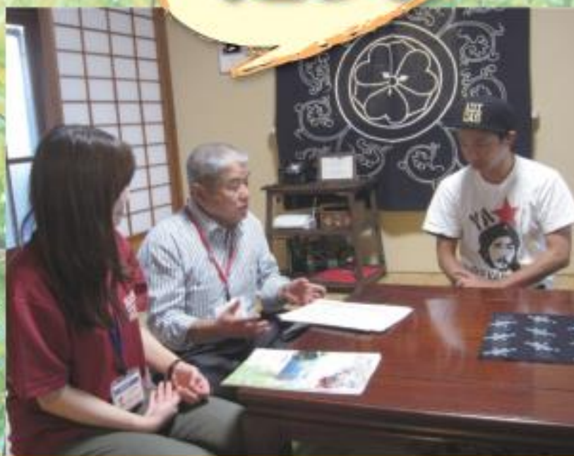
住まい、仕事、支援制度の紹介