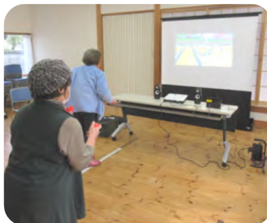
ボーリングで真剣勝負