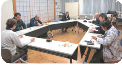
予定時間を超えて協議されました