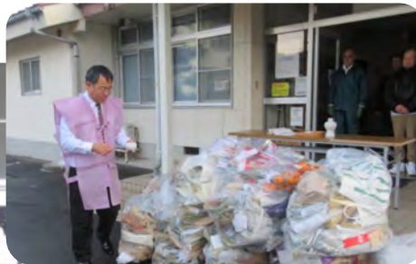
祝詞奏上前のお清め