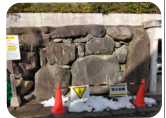
落石注意！ 4区空き家の石垣

◆牧田池から抜ける3区の高い擁壁については、町のほうから異常は無いと連絡が入りました。