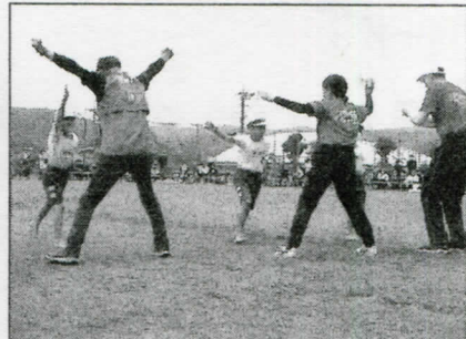
大人はそんなに甘くはないぞ!