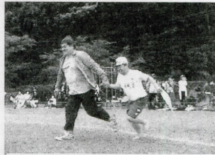
何度でも走ります! 子ども達のためなら...