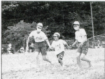
笑顔いっぱいゴール!