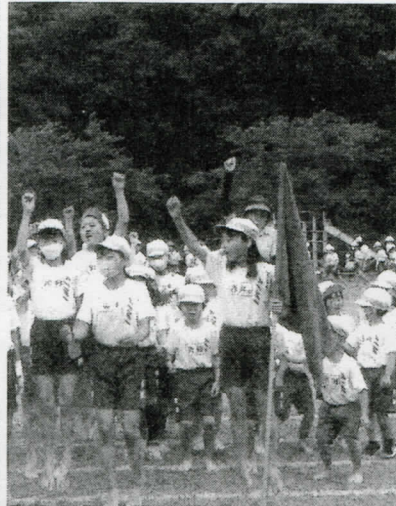
優勝めざすぞ! おーっ!