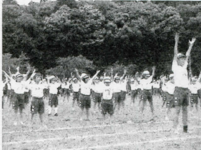
手足をビシッとのばして!

4年ぶりの全校児童で行う運動会には、早朝よりたくさんのお家の方・地域の方にご来校いただき、ありがとうございました。準備期間も短く、思うように進まなかったプログラムもありましたが、最後までご声援いただき、子ども達の大きな励みになりました。何よりも、たくさんの方の声援の中で演技できたことが、子ども達にとって一番の喜びとなったのではないかと思います。皆様、ありがとうございました。