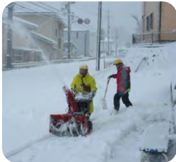
雪の降る中での除雪作業