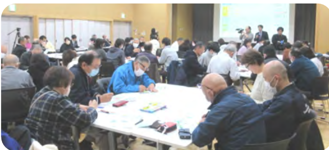
会場の様子と東西町地域振興協議会の研修風景

南部町の7つの振興協議会事務局と関係される方々が出席し、協議会ごとに今後の町づくりを考えました。