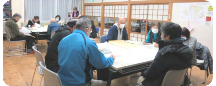
2グループに分けて評価・課題についての話し合いを行いました