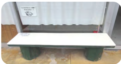
つどい前バス停のベンチの板がささくれているので修繕しました