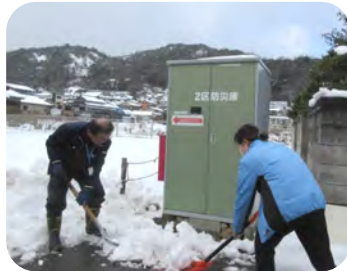
防災庫のドアの前に積もっている雪を取り除きました