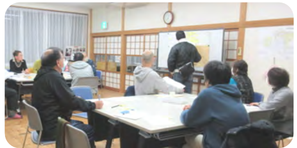
グループごとに発表していただきました