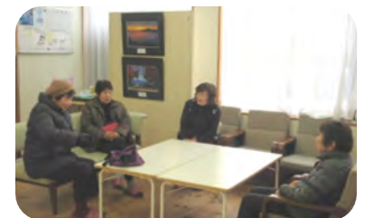
先日の木曜日に予行練習としておしゃべり会をされていました