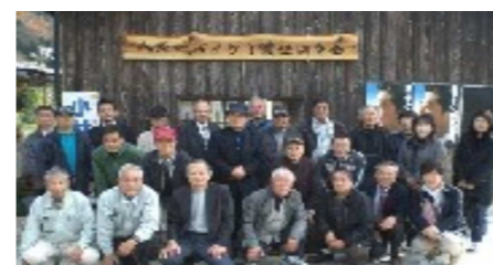
平成26年八頭町視察の様子

視察については、ここ数年行けていません。協議会全体の事業として防災・福祉・農業などの課題について研修できる視察先を探し、令和6年度はぜひ行きたいと考えています。