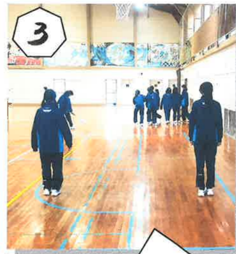
3 ヒント 風休みの日は、です。