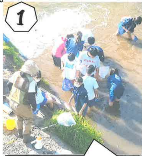
1 ヒント 野外で活動中です。