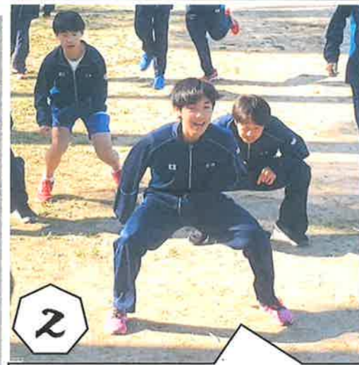
2 ヒント 1秒叩にこだわっています。