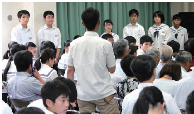
意見を聞く生徒も真剣です

7月12日、法勝寺中学校では、3年生による「まち未来会議」が開催されました。町長はじめ来賓、地域の方、保護者、2年生を含め200名を超える参加がありました。提案では、「愛される桜土手へ」「切った桜の活用」「デザイン性のある紙袋で南部町をPR」「地域全体で創り上げる安心の通学路へ」「サークルを通じた地域のつながりU18計画」の5つの意見が発表され、活発な質問や感想もありました。