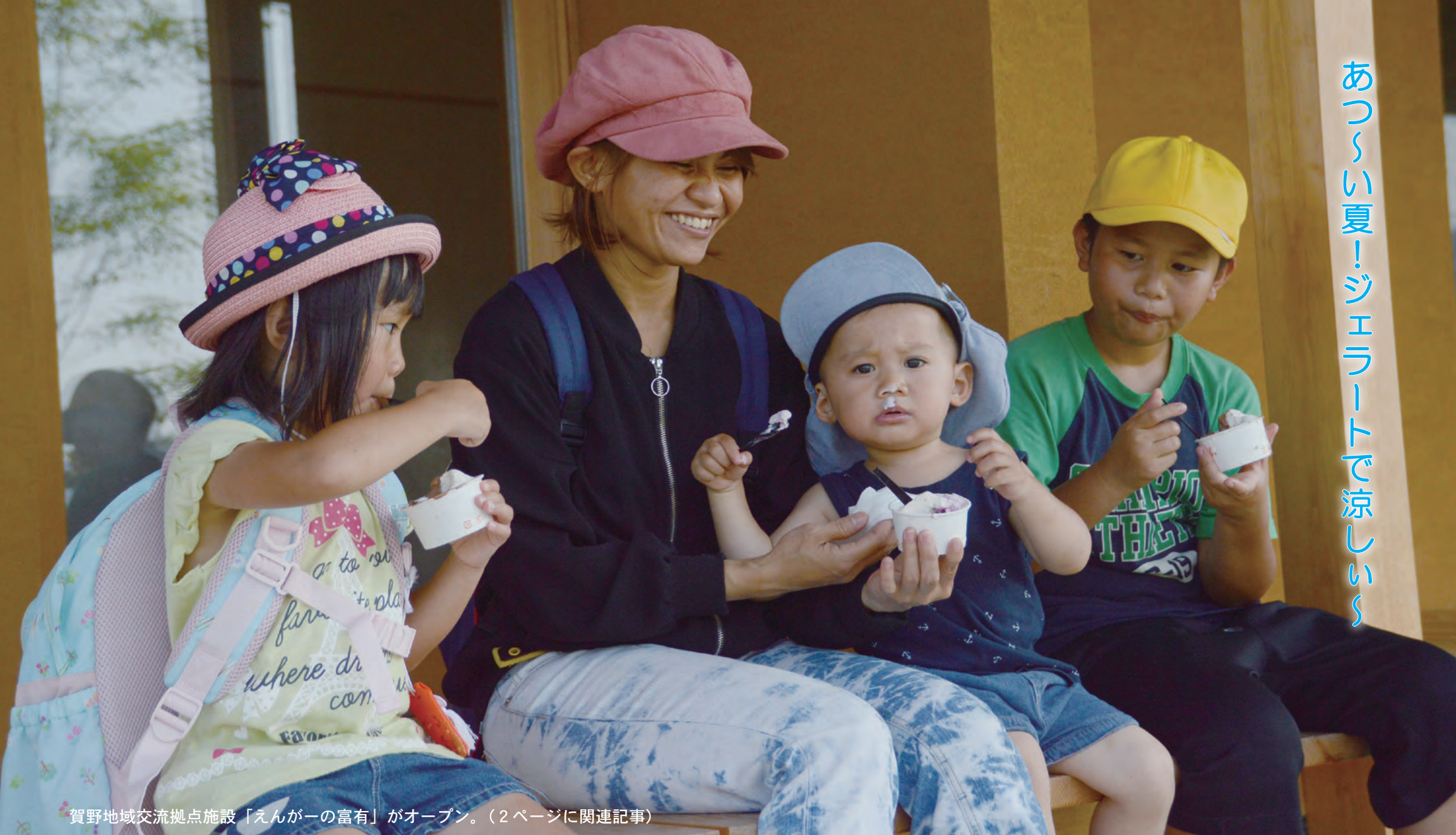
賀野地域交流拠点施設「えんがーの富有」がオープン。(2ページに関連記事)