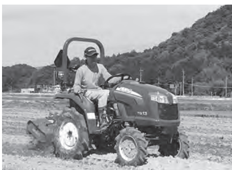
農機具の運転にも慣れてきました