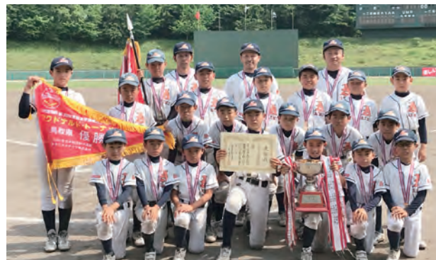
悔いのないプレーで頑張ってください

6月24日、倉吉市営野球場で高円宮杯第38回全日本学童軟式野球大会マクドナルド・トーナメント鳥取県予選決勝が行われ、会見スポーツ少年団野球部が日野ユナイテッドスターズを4-0で下して初優勝を飾りました。