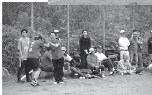
▲▲皆さんの声援が力になります