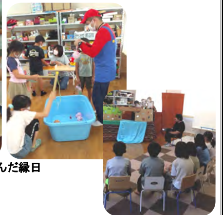
おはなしドンさん