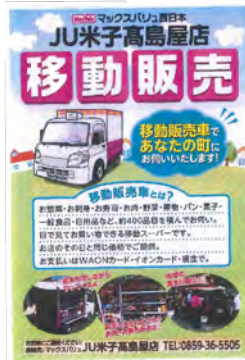
配布されたチラシ