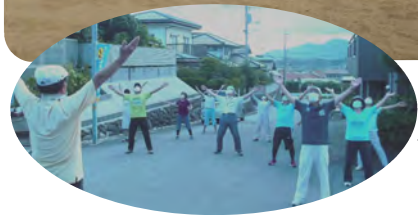
↑東西町スポーツ広場 間隔を空けて1・2・3 ←4区 美しい体操で1・2・3