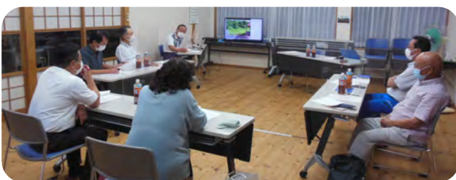
検討し、判定を行う委員の皆さん