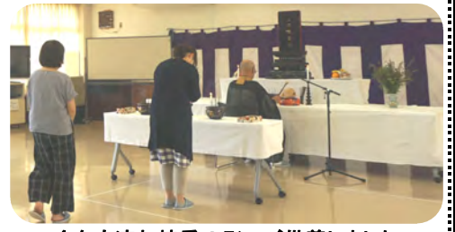
今年も流れ焼香の形でご供養しました

8月16日(火)東西町コミュニティセンターにて、町づくり部の行事であります「東西町仏様送り」を恵雲寺(えうんじ)住職様にお願いして開催いたしました。