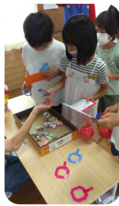
皆で楽しんだ縁日