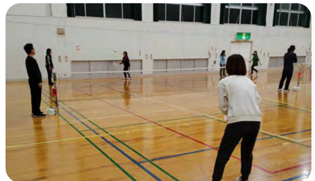
乱打練習の後はゲーム形式で楽しんでいます

バドミントンのコートで、ネットの高さ1m、テニスラケットの様なラケットでソフトボール位のビニールボールを卓球の様なルールで楽しむスポーツです。