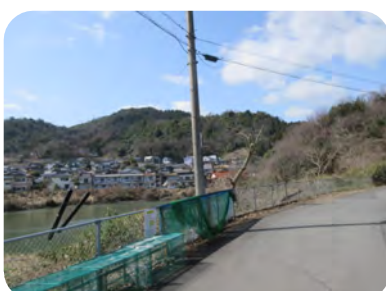
西町が見渡せるようになりました