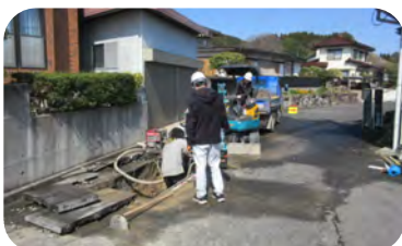
晴れた日に道路が濡れていたらお知らせください