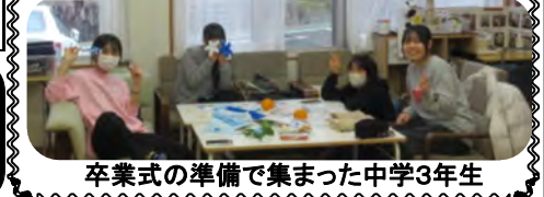
卒業式の準備で集まった中学3年生

駄菓子屋さん 中・高生有志による駄菓子屋さんを行います。 日時：4月2日(木)14:00~ 場所：つどい 久しぶりに開店します。皆さん来てください。