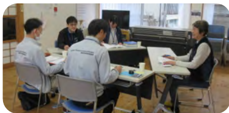
3月6日情報交換を行いました