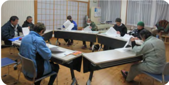
長時間にわたり話し合いが行われました

事務局からは、見守りの強化について、区会での支え合いマップづくり開催をお願いしました。