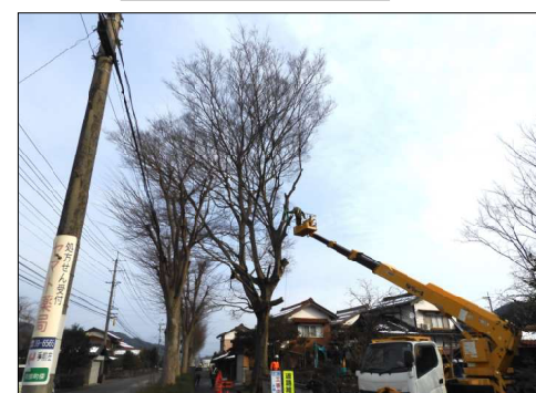
切り倒す前に枝を切り落とす