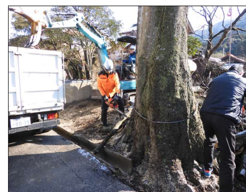
チェーンソーで切断

1月27日～29日、雪の降る中、倭区の旧法勝寺電車道線沿いにはみだしていた大きな樹木が、交通の妨害や学童の通行に危険を及ぼすので、南部町生活道路改善支援事業補助金を利用して伐採を行いました。