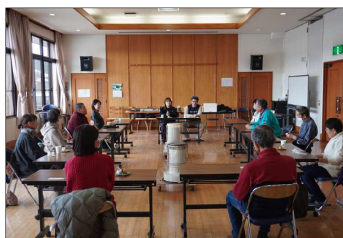
終了後のコーヒーを飲みながらの懇親会