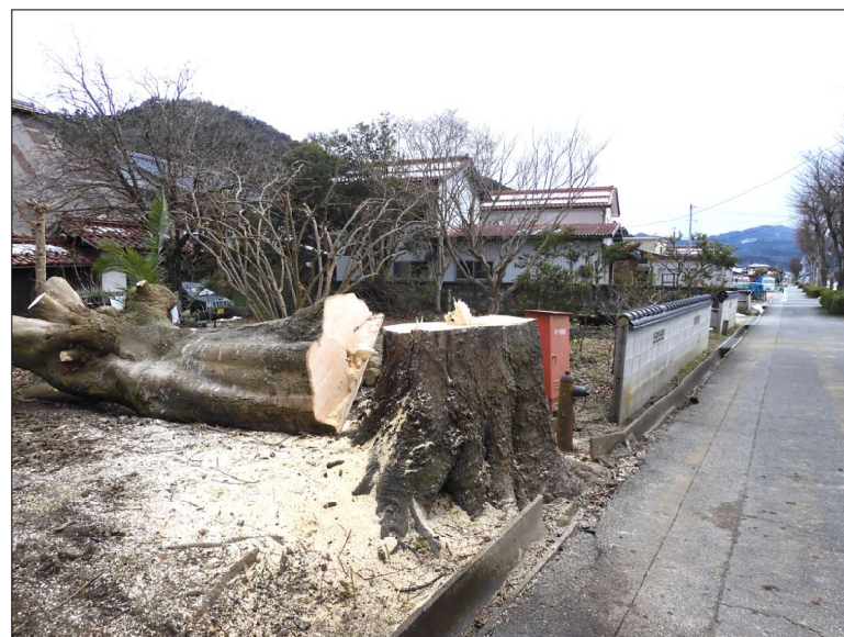
これだけ大きな切り株でした