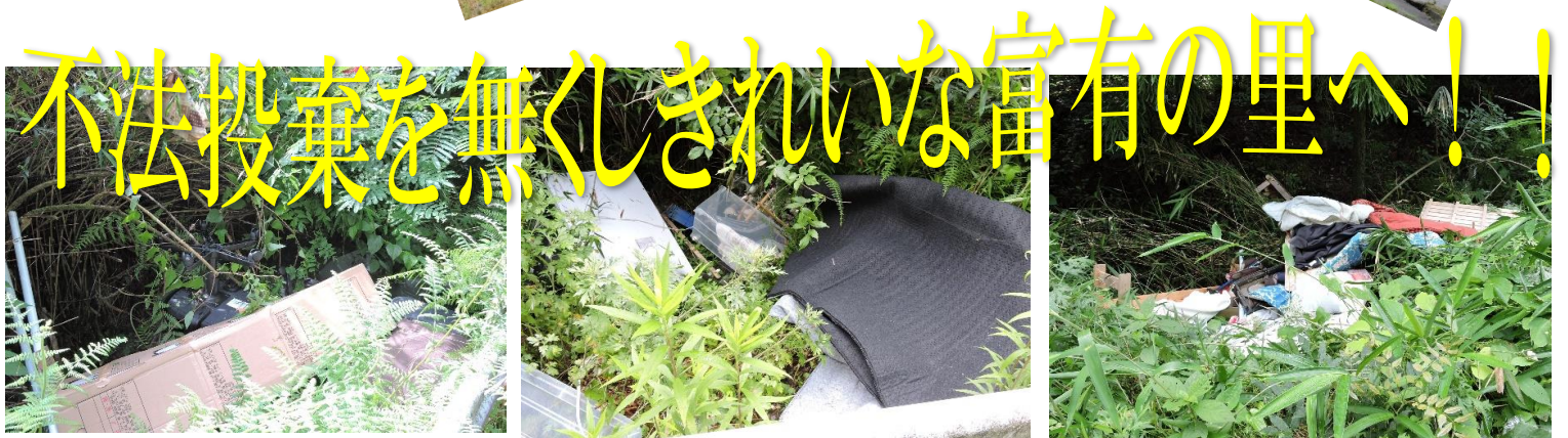
朝金地区内の町道脇