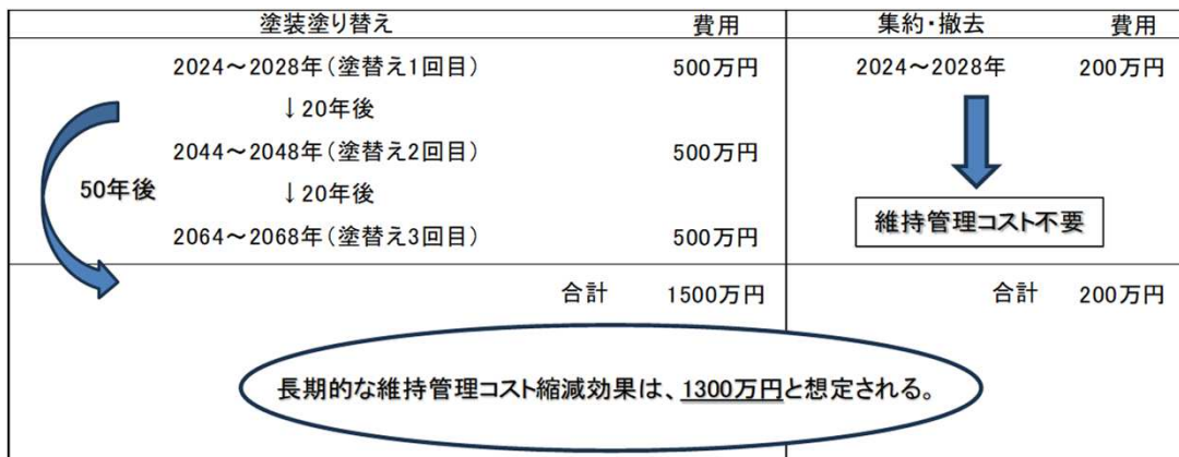
図 長期的な維持管理コスト縮減効果

また、今後50年間で1300万円の維持管理コストを縮減することを長期的な目標とする。 （下図参照）