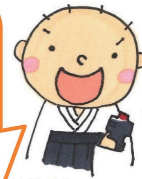
減塩推進キャラクター しょうから君

塩分摂取目標量 食塩相当量(g/日) 男性7.5g女性6.5g 出典「日本人の食事摂取基準(2020年版)」