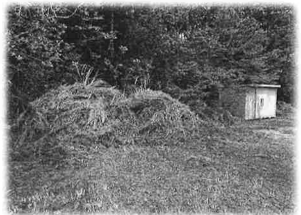
隣の物置よりも高く積まれた雑草

現在法勝寺中学校の野球部は部員1名(発行時現在)しかおりません。1人では練習もままならず、同じ町内の南部中に部活動支援バスで行き、そこで岸本中のメンバーと3校の生徒たちで練習しております。当然野球グラウンドは使われることがなく、使われなくなった野球場の雑草は伸びるがままとなっています。今後も法勝寺中学校単独で野球部を組むことは難しそうなため、今後も町総合グラウンドの使用機会は減ってしまいます。令和8年度には南部町では部活動の完全地域移行が行われる予定になっており、より一層グラウンドの使用機会は減っていくものと考えられます。このような状況ではグラウンドの管理も難しく一気に雑草が増えてしまいます。