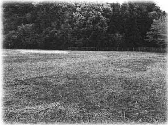
綺麗に雑草を刈っていただいたグラウンド

総合グラウンドの辺りまで桜を見に来られた方から、南部町の方に電話を頂きました。「野球場が荒れ放題になっていて、大変な事になっている。」という内容だったようです。その話があった少し前からグラウンドの様子を知っておられた町民の方が、先日学校を訪ねてこられました。その方から「以前野球に関わっていてグラウンドの様子を見てからずっと気になっていたの、草刈りをしておきました。」と伝えてもらいました。丁重にお礼をお伝えしたところです。早速グラウンドを見に行くと、背丈の高かった雑草がきれいに刈り取っており、グラウンドの隅に刈っていただいた雑草がとなりの小屋よりも大きく、高く積まれていました。