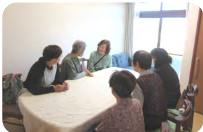
この部屋の皆さんはサロンの話？の後、トランプで楽しんでいらっしゃいました