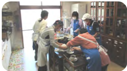
次々と注文が入り、てんてこ舞いのスタッフ

4部屋の好きな部屋でお茶をしながらおしゃべりがはずんでいました。 この日2時間に22名の方がお越しくださいました。