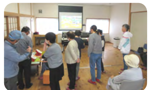
初めての方も安心。普及員がサポートします。