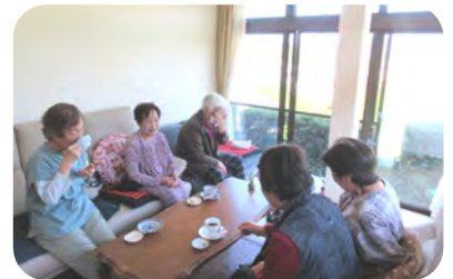
大山を眺めながらのお茶とおしゃべり最高～！

連休中は閉所でしたが、地域の皆さんに来てもらいたいと企画したところ、施設長はじめ、スタッフの皆さんも全員ボランティアで協力していただきました。感謝です。