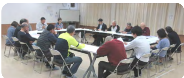
町づくり部会(主に理事の業務説明と一斉清掃について)

町づくり部会は5月11日、人づくり部会は5月7日、福祉部会は5月14日に開催され、部長が中心となって事業の説明などが行われました。