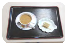
100円のコーヒーに、この日は手作り羊羹が付いてきました