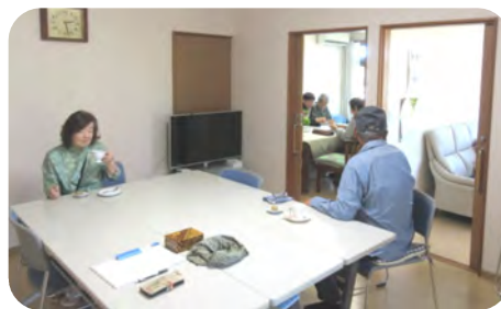
男性もお二人お越しいただきました。恥ずかしそうにコーヒーを召し上がっておられました。