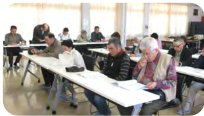
22名が出席した万寿会総会

令和8年度万寿連合会通常総会が5月10日(日)にコミセンで22名の出席者で開催されました。事業の活動人数は年間15の行事に対して255人の方々が参加されました。活動内容も年3回の旅行、運動会、ゲームなど誰でもできる楽しい催し物を計画しおこなっております。「フレイル」予防でいつまでも元気な高齢者を目指し地域で生活できるよう、東西町万寿会に参加して人生を楽しみましょう。又、参加することでお友達を沢山作り充実した生活を送りましょう。「引きこもり」は一番生活をつまらないものに