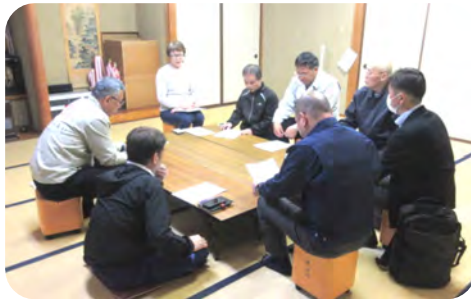
多くの協議事項について話し合われました