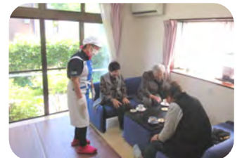
施設長が「西町カフェ」の説明もされていました

4部屋の好きな部屋でお茶をしながらおしゃべりがはずんでいました。 この日2時間に22名の方がお越しくださいました。