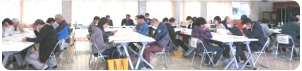
新年度の区長・班長へ説明を行いました