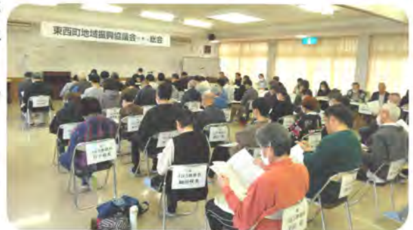
令和6年度代理人総会 新旧区長・班長の方々にご出席いただきました

なお、総会内で決算に一部修正がありました。修正部分と委任状のご意見欄の意見については、5月中に回覧でお知らせします。皆様のご協力ありがとうございました。