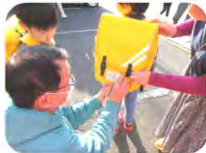
↑ランドナップに反射シールを貼ってもらいました ←緊張した面持ち、きちんと並んでバスを待ちました