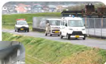
↑ 雨のため生徒と一緒に車で通学路の確認を行いました