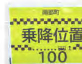
コミセン南駐車場の黄色い発着場表示