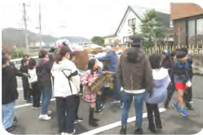
車で持ち込まれる資源に感謝

3月24日(日)心配された天気も時折小雨がパラつくことはありましたが予定通りリサイクル活動を実施致しました。多くの方がコミセンまで持ち込んでいただいたのでスムーズに行えました。ただ、持ち