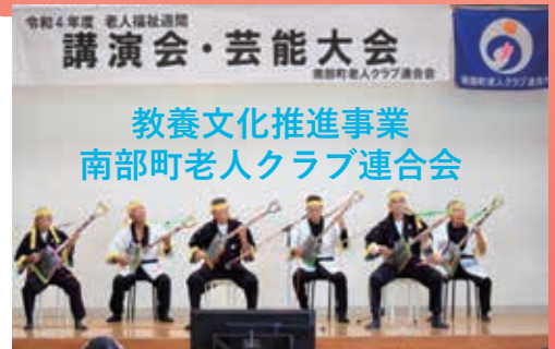
令和4年度 老人福祉週間 講演会・芸能大会