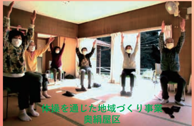
体操を通じた地域づくり事業 奥絹屋区