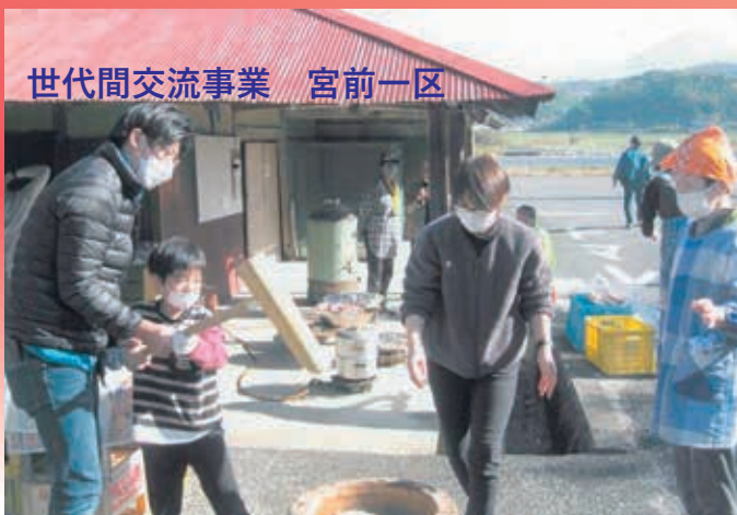
世代間交流事業 宮前一区