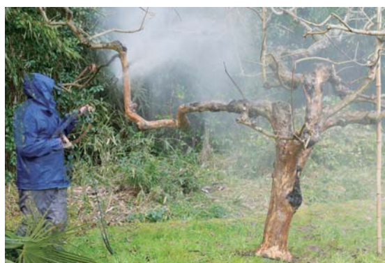
柿の木皮はぎ作業

南部広域シルバー人材センターでは、理事や会員による安全就業対策委員会を組織して、就業中の事故防止に努めています。同委員会では南部町、伯耆町でそれぞれチームを組み、様々な就業現場をパトロールし会員に安全就業を呼び掛けています。安全パトロールや安全就業研修に取り組んだ結果、ここ数年で会員の安全に対する意識も向上し、事故の件数も減少しています。