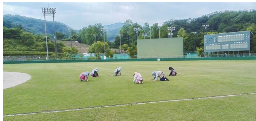
カントリーパーク野球場 (南部町内)

カントリーパークの大きな野球場のほか、隣接するテニスコート周辺や公園の草取りも行います。