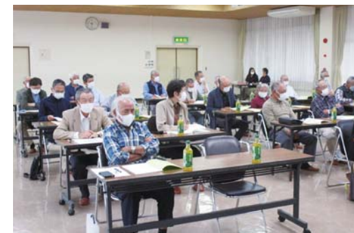
出席者限定で開催された令和4年度の定時総会

新型コロナウイルス感染症予防のため出席者数限定での開催 令和3年度事業報告、決算報告、理事・監事選任議案 (議案は全て承認されました)