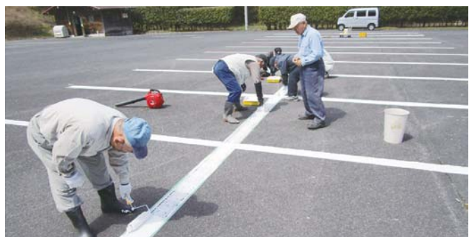
鬼っ子ランド駐車場ライン引き