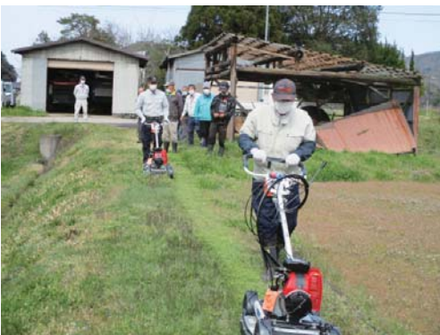
スパイダーモア実演講習会