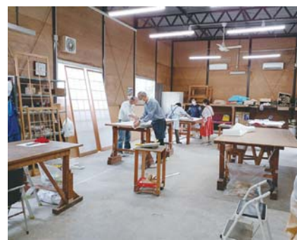
チームワークの良い障子張り班