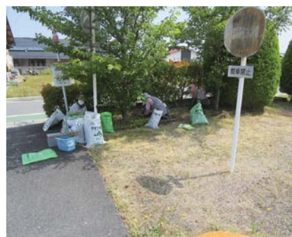
草取り作業 (伯耆町内)