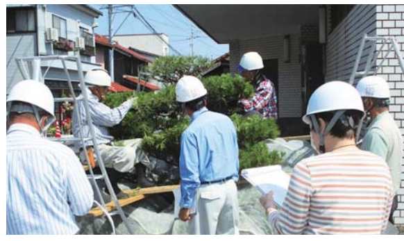
剪定の現場をパトロール中の安全就業対策委員

南部広域シルバー人材センターでは、理事や会員による安全就業対策委員会を組織して、就業中の事故防止に努めています。同委員会では南部町、伯耆町でそれぞれチームを組み、様々な就業現場をパトロールし会員に安全就業を呼び掛けています。安全パトロールや安全就業研修に取り組んだ結果、ここ数年で会員の安全に対する意識も向上し、事故の件数も減少しています。