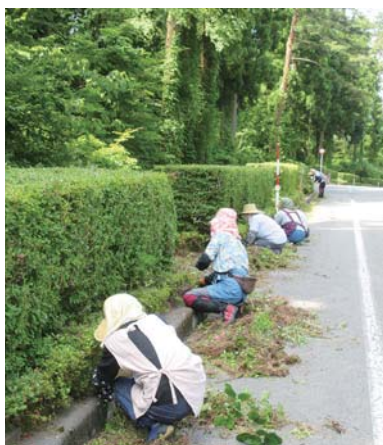
植樹樹除草作業 (伯耆町内)