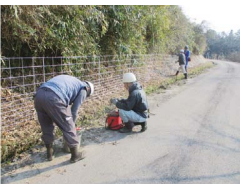
ワイヤーメッシュ設置 (南部町内)