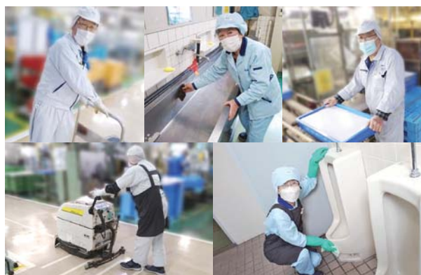
TVCで働く会員の皆さん(一部)

TVC(株)はNOK(株)の子会社で、自動車部品を中心に振動や騒音を低減させるための製品を製造している会社です。シルバーさんは創業間もなくから利用させていただいており、30年以上お世話になっております。シルバーの会員さんには掃除や製造補助作業の仕事をしていただいておりますが、熱心な方が多く責任感もあり、細かなところにも気づいてもらえ、大変助かっています。最近では、人手不足でなかなか勤務いただけの方が見つからないこともあり、今後もお世話になると思いますので、宜しく申し上げます。