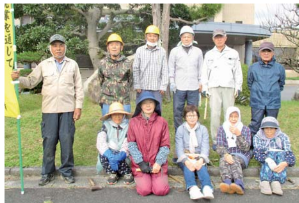
会見地区の参加会員