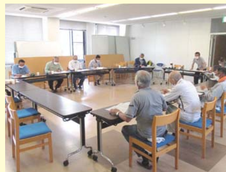
パトロール後の検討会

会員の皆様の安全就業の意識を高め、もたらうために、シルバー人材センターでは、理事や安全就業対策委員などの役員が、定期的に就業現場の安全パトロールを行います。パトロールは毎回打ちで実施します。チェック項目は、ヘルメットやベルトなど保護具の着用、道具の点検や適切な使用方法など、多岐にわたります。就業されている会員さんからの要望を聞くこともあります。最大の目的は「情報共有」です。熱中症対策の注意喚起など、すべては「事