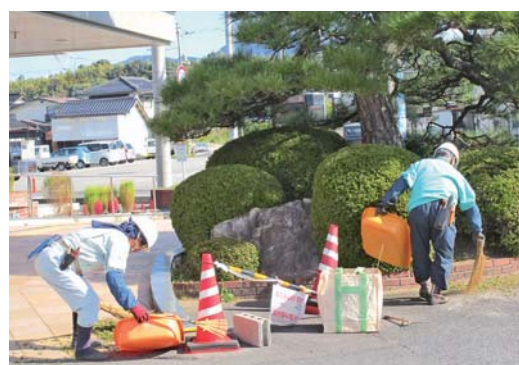
岸本公民館での作業