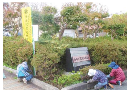
南部町役場天萬庁舎での草取作業

南部広域シルバー人材センターでは、公共施設の草取りや植木剪定、清掃作業などの奉仕活動を行っています。奉仕活動を行うことにより、地域の皆様にシルバー人材センターの活動を、広く知っていただくことや、参加する会員相互の交流も深めるなど、日頃の感謝の気持ちを込めて実施します。