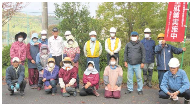
溝口地区の参加会員