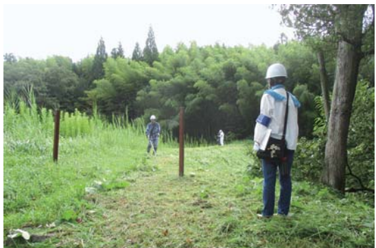
理事パトロール（南部）

本センターの理事・監事17名の重要な責務は、年3回開催される理事会での経営方針、収支予算、決算などに関する議案の審議。このほか、理事により組織される部会の活動や安全パトロール、公益法人役員の役割や責務などについての研修、会員拡大活動などを、年間を通じて行っています。