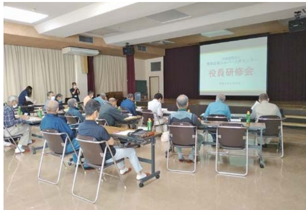
公益社団法人について学ぶ研修

理事の役割は議案の審議をはじめとしてそれぞれが属する安全就業研修部会、普及啓発部会、就業拡大組織部会の活動を担います。また、2名の監事は年数回の監査を実施し、センターの運営状況を厳しくチェックします。公益法人の経営を審議する上では、同法人についての研修もかかせません。この他、シルバーの基本となる安全就業を支えるパトロールも行います。また、年間を通じて会員数の拡大活動にも取り組んでいます。