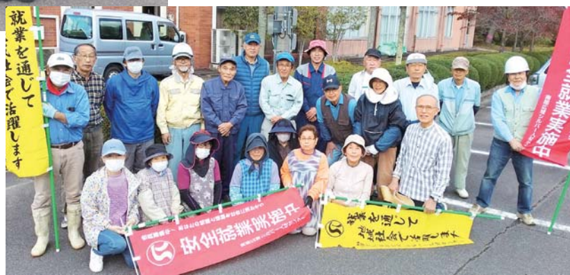
西伯地区の参加会員