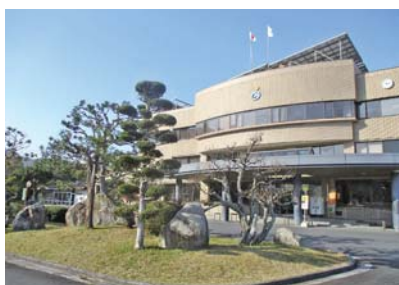
南部町天萬にある天萬庁舎

毎年、シルバー人材センターの方に天萬庁舎の敷地内にある木の剪定、消毒や草刈り等、また庁舎内の清掃をお世話になっております。天萬庁舎は、町役場としてだけでなく、図書館や公民館も併せて利用いただいている施設です。シルバーさんの誠実で丁寧な作業によって、天萬庁舎の周りの景観や建物内の環境が、きれいに保たれており、住民の皆様が気持ちよくご利用いただけていると思っております。いつもありがとうございます。今後も引き続きお願いします。