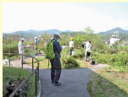
安全就業委員によるパトロール

本センターの理事・監事17名の重要な責務は、年3回開催される理事会での経営方針、収支予算、決算などに関する議案の審議。このほか、理事により組織される部会の活動や安全パトロール、公益法人役員の役割や責務などについての研修、会員拡大活動などを、年間を通じて行っています。