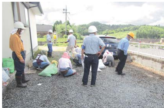
理事パトロール（伯耆）

理事の役割は議案の審議をはじめとしてそれぞれが属する安全就業研修部会、普及啓発部会、就業拡大組織部会の活動を担います。また、2名の監事は年数回の監査を実施し、センターの運営状況を厳しくチェックします。公益法人の経営を審議する上では、同法人についての研修もかかせません。この他、シルバーの基本となる安全就業を支えるパトロールも行います。また、年間を通じて会員数の拡大活動にも取り組んでいます。