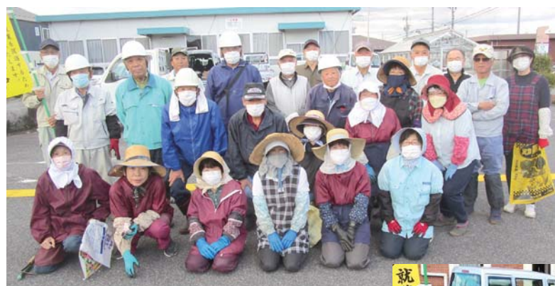
岸本地区の参加会員