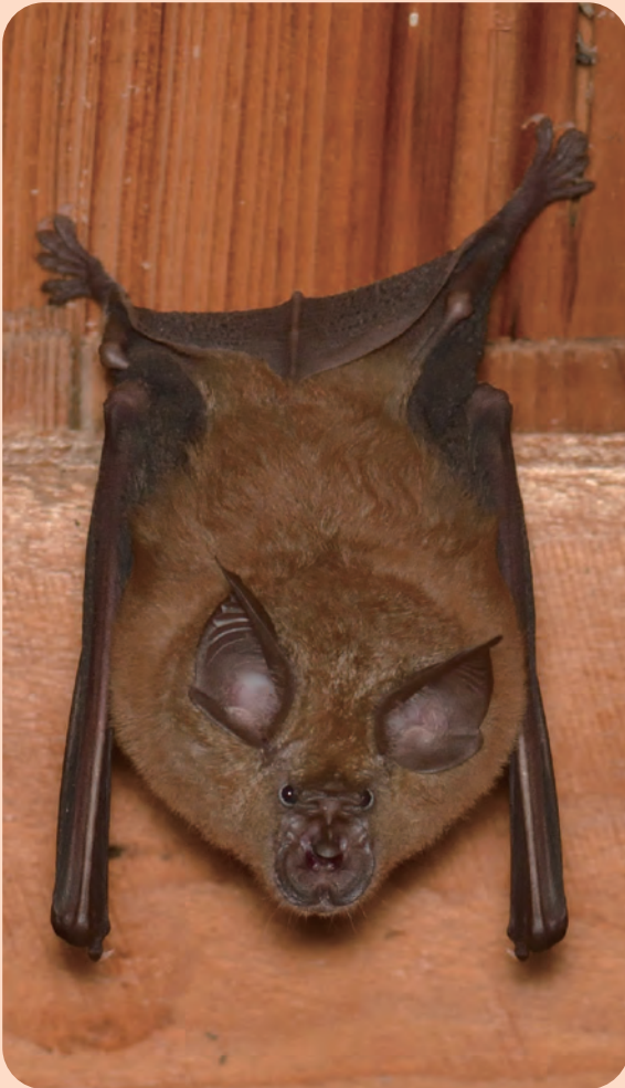
西伯地区 鳥取県レッドデータブック(RDB)：情報不足(DD)