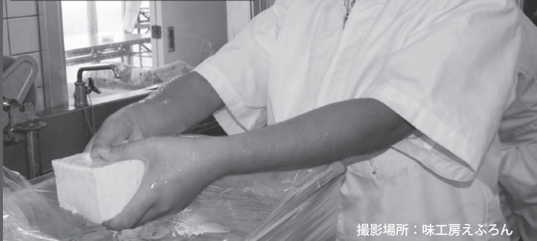
撮影場所：味工房えぷろん