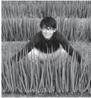
大きく育ったねぎに囲まれて

そして協力隊としての二年目が始まっています。一年目はずっと気にしていたつもあまりできなかつた協力隊としての地域に還元できる何かを、今度こそできるようにしたいなと思っています。また、任期終了後も南部町でやっていくための準備もどんどん進めていかなければなりません。これからもこの町での生活や、就農のための準備などでお世話になります。どうか皆さんよろしくお願ひします！