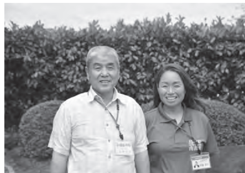
移住コーディネーター 就職支援員

借り上げ料として、固定資産税相当額しか出せませんが、人が入る事により管理が不要となり家も長持ちしますし、10年後には改修した家をお返しいたします。もちろん、更新も可能です。なお、不用品家財等がある場合は、定額ですが処分費用をデザイン機構が負担します。空き家で困っていらつしやる方や空き家に関する情報がありましたら、お気軽にご相談ください。