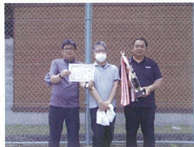
優勝 倭 Bチーム