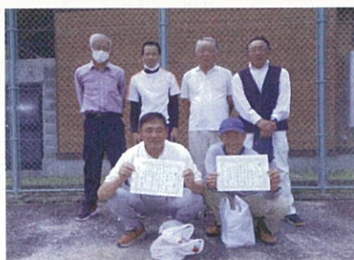
2位 原 Aチーム 3位 原 Bチーム