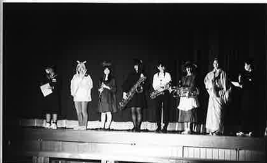
毎日が every day ☆