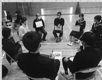
フリップを使って説明。徐々に盛り上がりました。