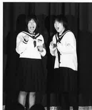
ラブラブラブリー