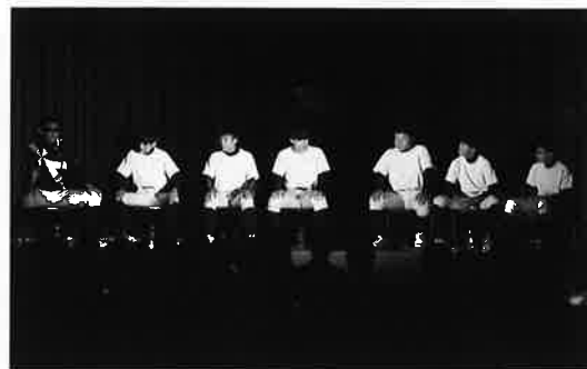
7匹のクワガタ納豆リベンジャーズ