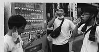
疲れを癒す一杯、 やっぱり手は腰に