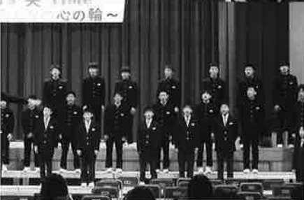
本番直前最後の練習