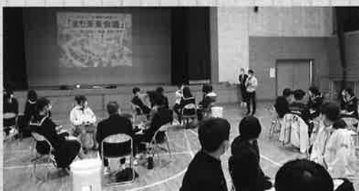
南部町の未来などの説明。皆さん真剣に聞いています。

参加者は7グループに分かれて着席、コーディネーターの人権・社会教育課の大下さんから「二十歳の自分」、「ふるさとって何？」などの説明を受け、その後はグループごとに「中学生のうちにしておいたほうが良いと思うこと」「これからどんな大人になっていきたいか」などのテーマをフリップを使って語り合いました。最初は「何をやるの?」とみなさん不安そうな表情でしたが、すぐに各グループ盛り上がり、予定の2時間があっという間に過ぎました。