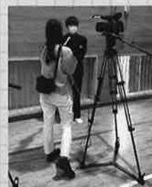
なんぶSANチャンネルのインタビュー