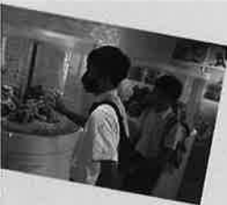
たくさん買いました。