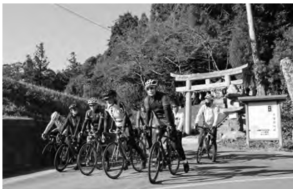
◀鳥居を背に出発する参加者

今後も、子どもからお年寄りまで、里地里山や食を楽しむサイクリングイベントを開催していく予定です。