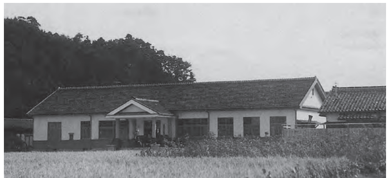
▲設立当時の病院外観

これからも地域の皆さまが安心して暮らし続けられるよう、職員一同、皆さまから愛され、信頼される病院を目指して参ります。