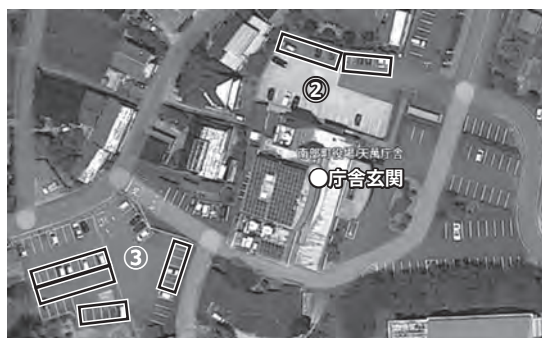
②天萬公民館裏側駐車場 ③てま里側駐車場