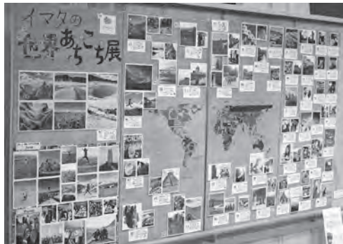
▲イマタの世界あちこち展展示風景