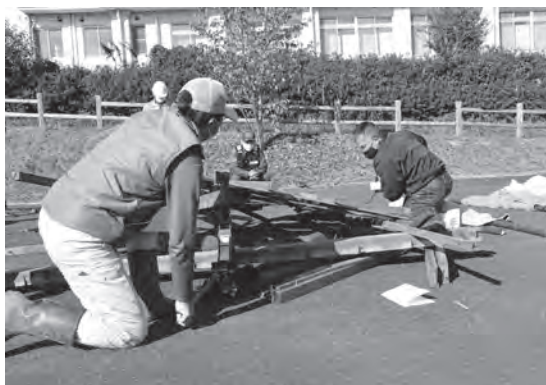
▶ジャッキで持ち上げます