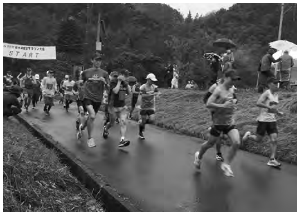
◀雨の中走り抜けるランナー

10月17日、雨が降りしきる中、第34回南部町緑水湖健康マラソン大会が行われました。当日は216名の選手がエントリーし、緑水湖周辺コースを駆け抜けました。