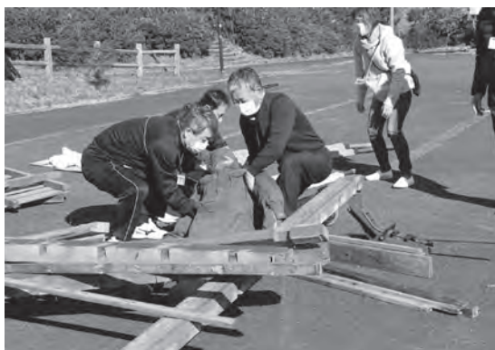
▶救助した人を担架で運びます

11月7日、天津地域振興協議会では地震発生時の防災訓練を実施しました。訓練は、大地震が発生して山間の一軒家の住宅が倒壊し、住居人が下敷きになっているという想定で行われました。 21名の参加者は5人1組に分かれ、下敷きとなった住居人への声掛けを行いながら倒壊した建物を取り除いたり、警察・消防への連絡を行ったりと、力を合わせて救助を行いました。実際の大地震では、救助に必要な資材がない場合もあることから、竹棒と