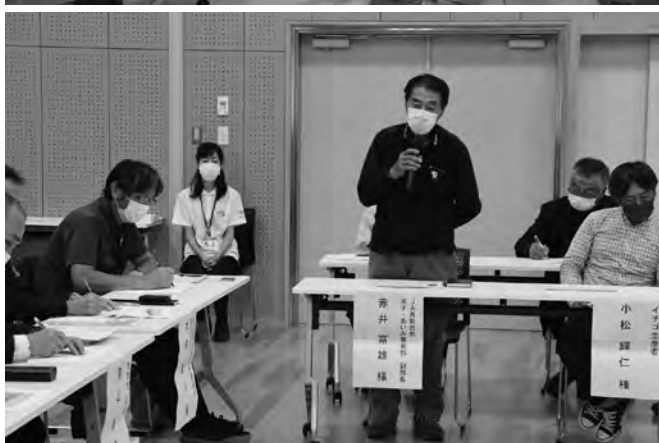
▲意見を交わす参加者