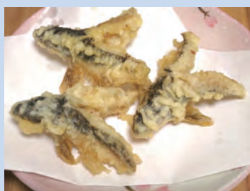
▲カマツカの天ぷら

実は、全く同じ和名で樹木にもカマツカというバラ科の落葉広葉樹があります。鳥取県内でも広く自生し、とりと花回廊でも植栽されています。魚のカマツカの名の由来は、鎌の柄のように体の表面が硬いからというのが有力で、植物のカマツカは材を鎌の柄に使ったことから言われています。同じカマツカつながら、もし機会があれば木のカマツカでお箸を作って、それで調理された魚のカマツカの身をほぐすなんてことも出来なくはなさそうです。こんな遊び心も在来の生き物たちの賑わいがあったこそ。どちらのカマツカちゃんも身近な存在であればと思います。