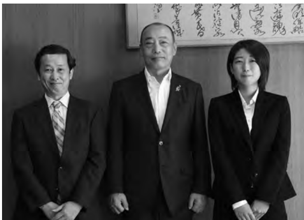
◀陶山町長を囲む訓練生

青年海外協力隊として海外へ赴任予定の3名が、南部町で特別派遣前訓練を行うため来町しました。これは、新型コロナウイルスの影響ですぐに派遣国へ行くことが出来ない隊員が、赴任までの間に国内でのフィールドワークなどを行うものです。