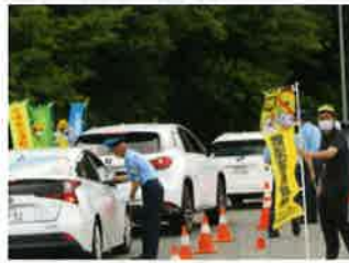
広報検問(淀江町本宮)