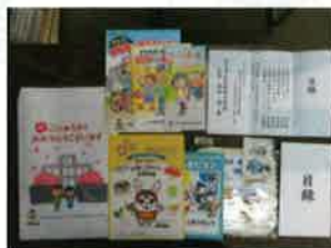
新入学児童への交通安全用品