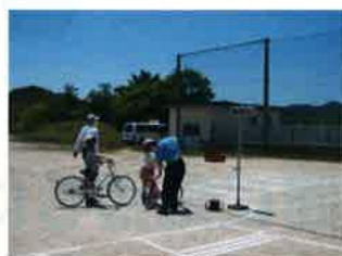
自転車教室(尚徳小学校)