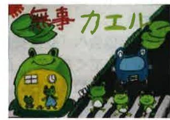
交通安全ポスター最優秀作品