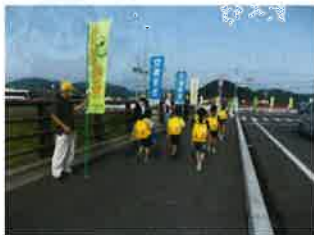
誘導活動(新青木橋)