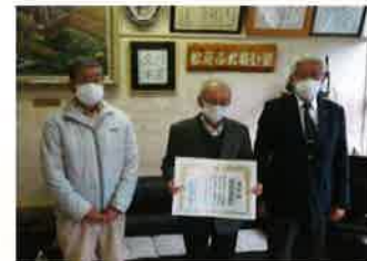
全日本優良団体表彰(富益支部)