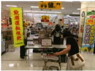
飲酒運転根絶広報(日吉津村)