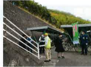
自転車マナーアップ広報(米子西高校)