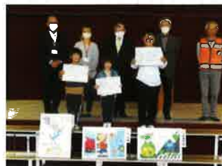
交通安全ポスター最優秀 賞等受賞(彦名小学校)