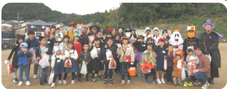
東西町スポーツ広場で集合写真