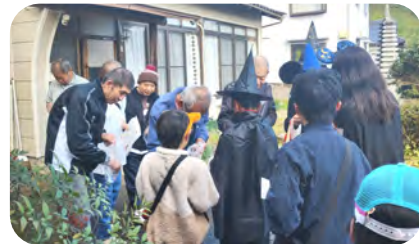
ホストに申し込んでくださった方、快く引き受けていただいた方に感謝です