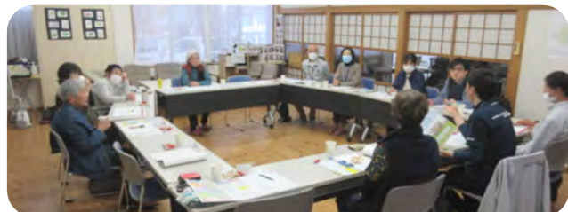
普段余り出かけられない方との交流につどい活用を検討

誰もが住み慣れた地域で安心して生き生きと暮らし続けるために支え合う地域づくりを目指し、話し合いを行っています。