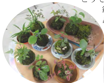
苔玉教室の参加者と制作した苔玉