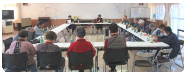
全体会議で使用後の確認をお願いしました

今年は、コミセンの窓と窓枠は清掃業者に依頼し、それ以外の場所の清掃を皆さんにお願いしました。つどいは窓や床等全館の清掃をお願いしました。