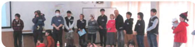
新しい仲間のみなさんから自己紹介