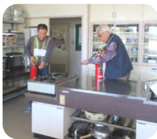
消火に向かう消火役2名

出火はコミセン調理室と想定し、参加者の中から総指揮官役を選出し、火元確認及び消火役、通報役、避難誘導役、施設内確認役、避難場所人数確認役を決めて、全員が安全に避難できるよう訓練しました。