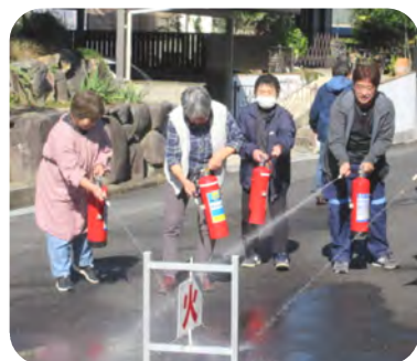
火元を狙って消火訓練をしました