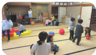
遊び場となった和室でちびっこ の交流も行われました