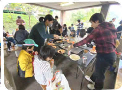
ハロウィンで歩き回ってお腹ペコペコ、BBQで大満足