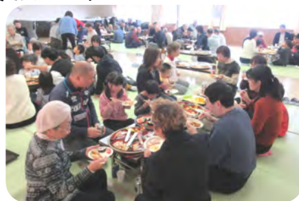
お腹いっぱい食べてもらいました