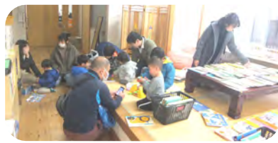
絵本市もチビッコ連れの若い家族でいっぱい