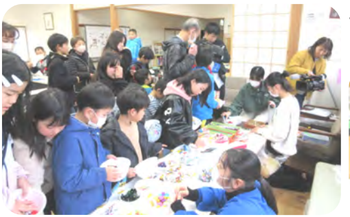
大盛況、てんやわんやの駄菓子屋さん