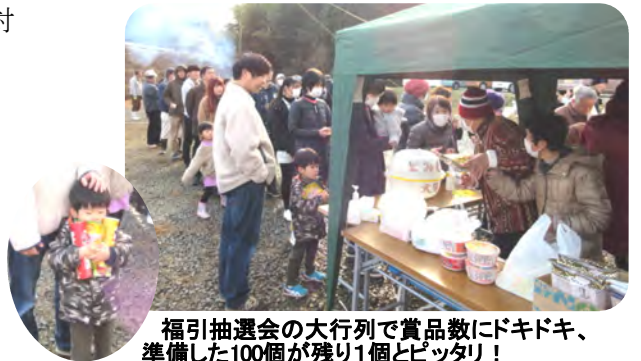
福引抽選会の大行列で賞品数にドキドキ、準備した100個が残り1個とビッパリ!