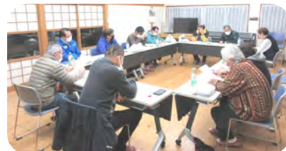
第4回目となる運営委員会 短時間で、多岐にわたり話し合いを行いました

報告・検討事項：各部や区・事務局から連絡や報告がありました。3区長より会報「まち」が身近で、見ていて楽しいという感想と、同好会等の活動の様子も掲載してはどうかとの提案もありました。