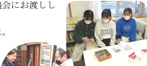
初めての駄菓子屋さん出店に、仕入れから販売まで頑張ってくれました。あまりの忙しさに達成感とともに終了後、しばし放心状態の3名お疲れ様でした