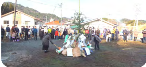
年女のお二人に火入れをお願いしました