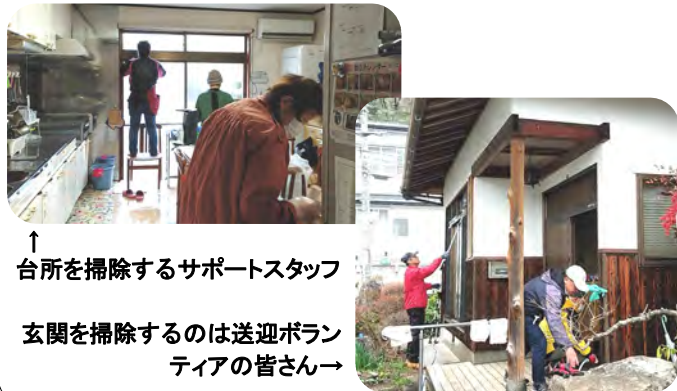
↑ 台所を掃除するサポートスタッフ