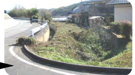
なんとということでしょう~ アフター(スッキリしました)