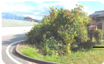
ビフォー(雑木や竹がびっしり)

新年早々の1月4日~6日にかけて、東西町スポーツ広場進入路南側の雑木や竹等の伐採作業がおこなわれました。 とてもきれいにスッキリとなりました。今後、定期的な除草や管理などについて検討したいと思います。