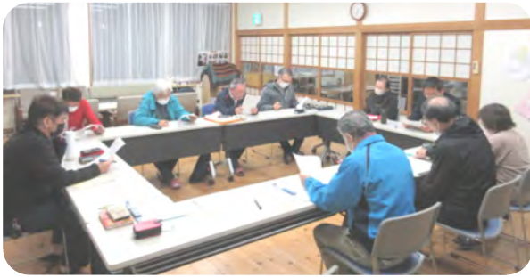
全員出席の運営委員会