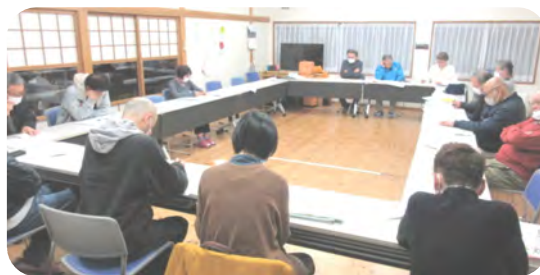
1回目の策定委員会

今後2回目の会で課題をまとめ、その後、住民説明会を開催し、6月頃に全戸に配布する予定です。