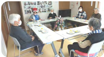
皆でケーキもいただきました

12月18日(水) 利用者とサポート員・施設長・統括管理者によるクリスマス会を行いました。 手作りのクラフトバンド靴のプレゼントに利用者の方は大喜びでした。