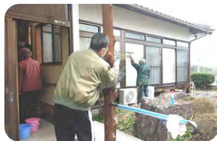
外回りもスッキリしました

12月26日(木)には、サポート員と送迎担当で、恒例の年末大掃除が行われました。 1年間の無事とボランティアの皆さんに感謝です。