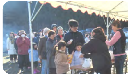
福引抽選(中学生の協力に感謝)