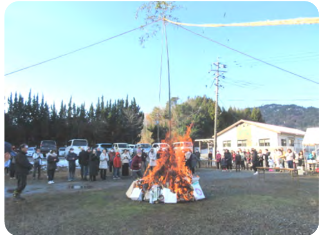
炎が高く上がった一斉のお焚き上げ