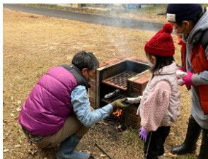
美味しい焼き芋ができあがりしました