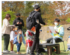
チェックポイントでスタンプをゲット!