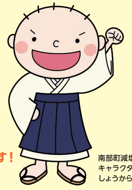
南部町減塩推進 キャラクター しょうから君

いま、日本人の 2人に1人が がんになっています! みんなで 「いかいや!けんしん!」