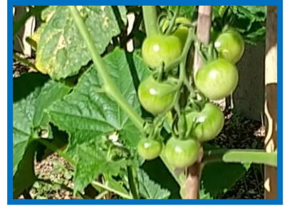
学級花壇で収穫を待つミニトマト