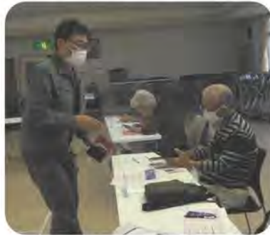
頭の運動になるスマホ教室

定員12名のところ参加者は8名でした。教室では、 基本の操作からイン ターネットやアプリ の使い方までを習い ました。