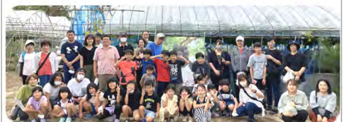
高級ブドウでお腹いっぱい…自然と笑顔になりました