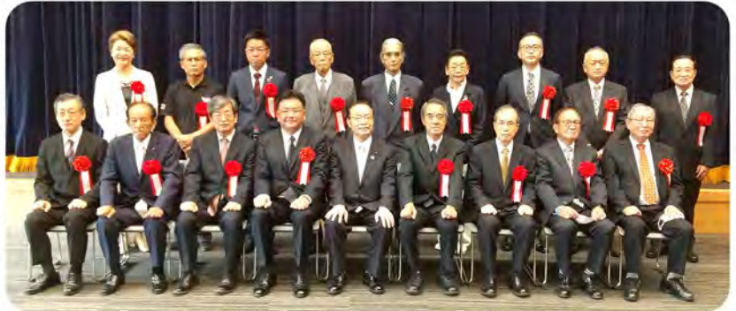
谷防災担当大臣(前列中央)、会長代理出席の黒木事務局員(後列左)

全国で26団体が表彰された中、東西町地域振興協議会の受賞理由としては、「平時より防火・防災意識を向上させるために避難訓練・消火栓及びホース接続訓練・出張