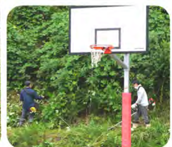
バイパス側の側溝や山もスッキリとしました