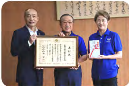
翌日、陶山町長に報告を行いました

皆さまのご協力のお陰でこのような賞をいただくことができました。ありがとうございました。今後も更に安全で安心して暮らせる町づくりを目指して行きますので、ご協力をよろしくお願いいたします。