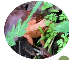
参加者の方が珍しいカエルを発見!!