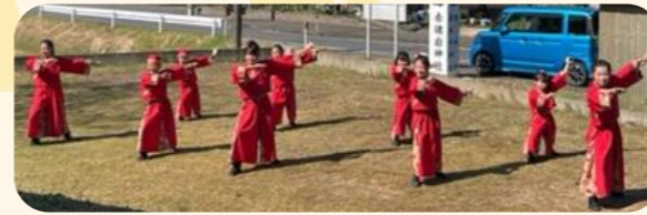
よさこい踊りのパフォーマンス