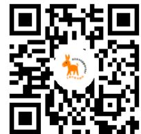
▲申込用二次元コード