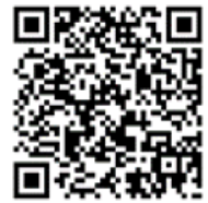
▲米子保健所 ホームページ