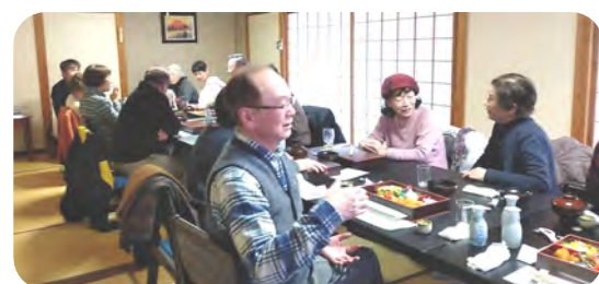
6年半振りの会食で親睦を深めました