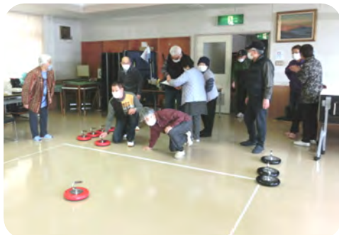
あれ〜どこ行くの〜！ ジェットローラーに聞いて〜

なかなかお出掛けして身体を動かすことの少ない冬場ですが、今回26名と多数の方々に参加、4チームに分かれて元気いっぱい笑顔のなかで真剣に競技が競われました。久しぶりのお友達とのお話し等、