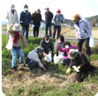
七草粥食材のセリを発見!

3月3日(日)に行われた七草探しの健康ウォーキングに近所の健康増進委員の方に誘われ、初めて参加しました。雪が降った翌日の風の強い日でした。歩くときは陽の光もあり、田んぼ道をお喋りしながらの気持ちいい探索です。