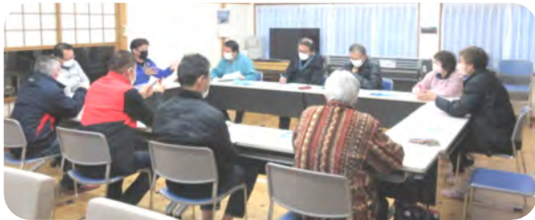
盛りだくさんの内容を協議する運営委員会