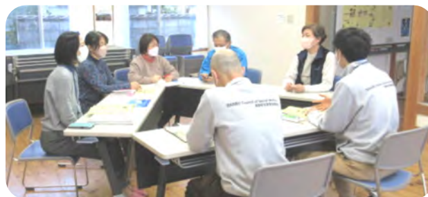
町の本気度も伝わってくる毎月の定例ミーティング