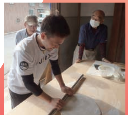
助成事業紹介(一例)