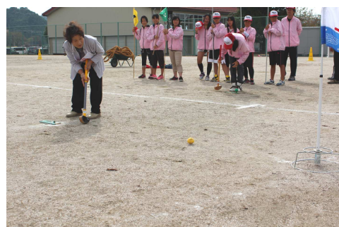
おおくに大運動会