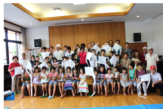
三世代交流工作大会