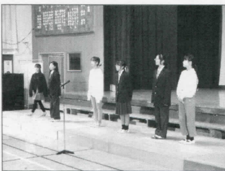
6年 わたしたちの描く 未来の南部町