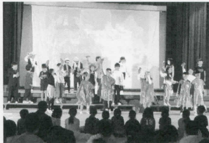
2年 あいちゃんの「名前を見てちょうだい」