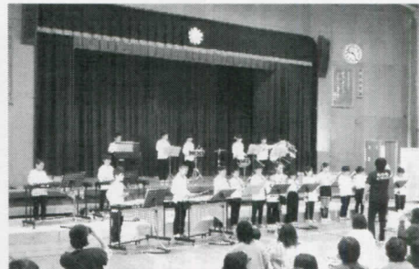
3年 リメンバー・ミー 見上げてごらん夜の星を～ぼくらのうた～