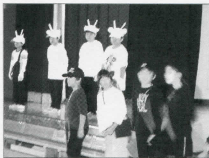
4年 「まいど、ゆうびんです！」