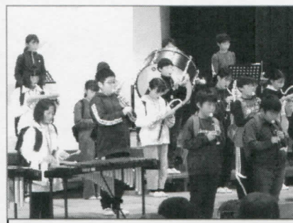
5年 大山とともに ～リコーダー、合奏にのせて～