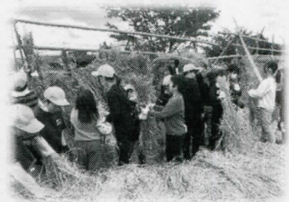
5年 稲刈り・はでかけ