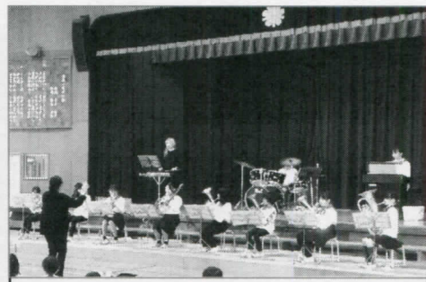
金管クラブ フレール・ジャック あいことば