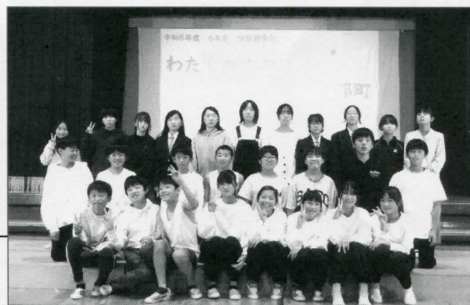
よく働き、よく演じた！さすが最上級生！