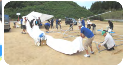
片付けも皆さんの協力に感謝です