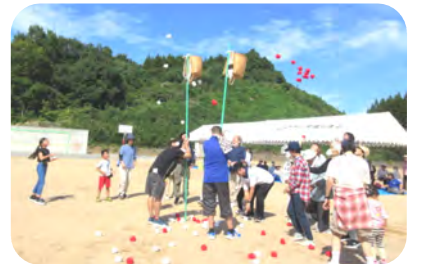
人数制限なしの玉入れ