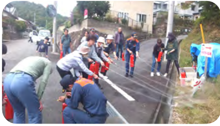
イザという時に使えるように何度でも訓練を