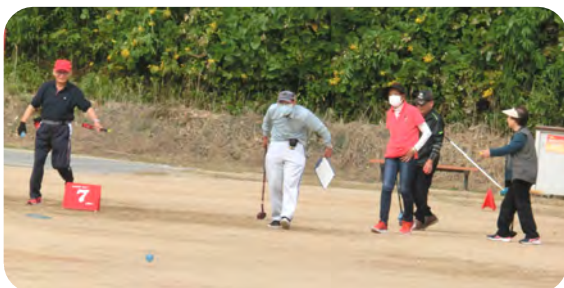
日頃の練習の成果が集中力か？どちらでしょう