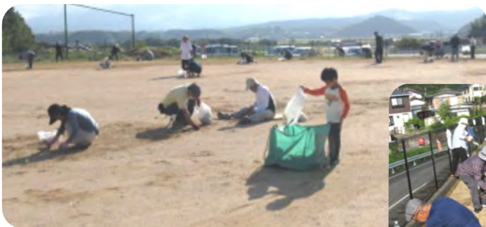
10月6日のウォーキング・ミニスポーツ大会、親睦会もきれいになったグラウンドで気持ち良く開催できました

9月29日(日)朝8時から恒例の東西町スポーツ広場草取り・整備を行いました。この日もとても暑い日でしたが、80名もの方が協力してくださいました。