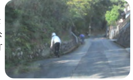
郵便局前の西町山側の清掃作業