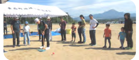
各区が全員であのゲートをねらえ！