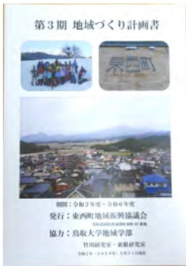
4年前に作成された第3期地域づくり計画書

第4期地域づくり計画書は、東西町全体から選任し、第3期地域づくり計画書の評価を行って進めたいと思います。