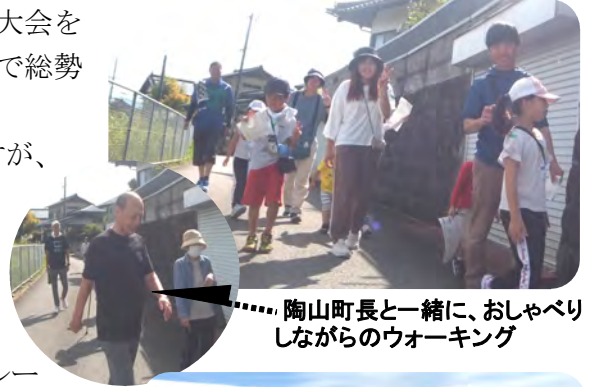
.....陶山町長と一緒に、おしゃべりしながらのウォーキング