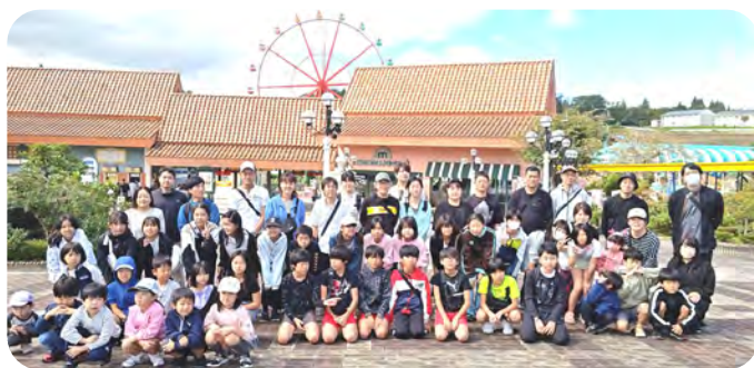
蒜山ジョイフルパークにて