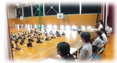
【学校のために力を尽くす！～生徒会役員選挙～】