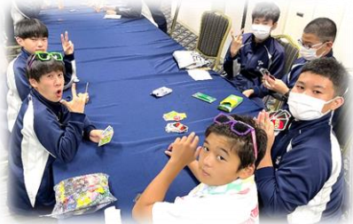
【就寝前の楽しいひととき ～修学旅行～】

2学期はまだまだ始まったばかりですが、これからも「自律」と「共生」を目指して、生徒・保護者・地域、そして教職員が目標をひとつに学びを進めていきたいと思ひます。