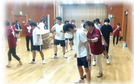
【地域の宝を引き継ぐ ～小松谷盆踊り伝承学習～】