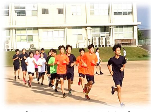
【仲間を信じて！～南中駅伝部～】