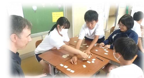
【班の仲間と学びあう ～1年学活の授業～】