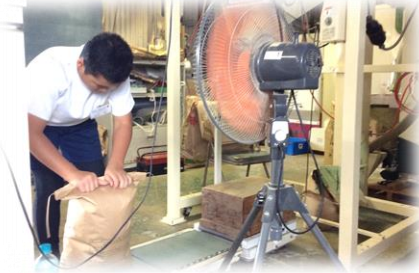
【地域の方と共に「働く」～職場体験～】