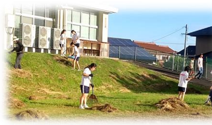
【地域の方・保護者と共に ～環境整備～】