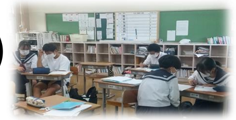
【今、ここ！集中しています！～放課後学習～】