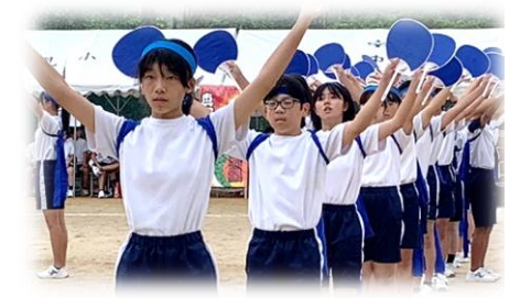
【縦割り応援合戦 ～体育祭～】