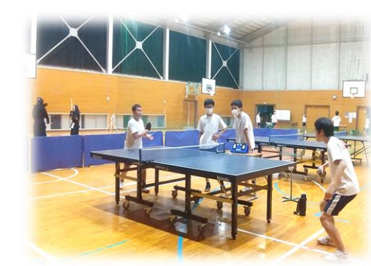
【部活動にも熱が…～明日から新人戦～】